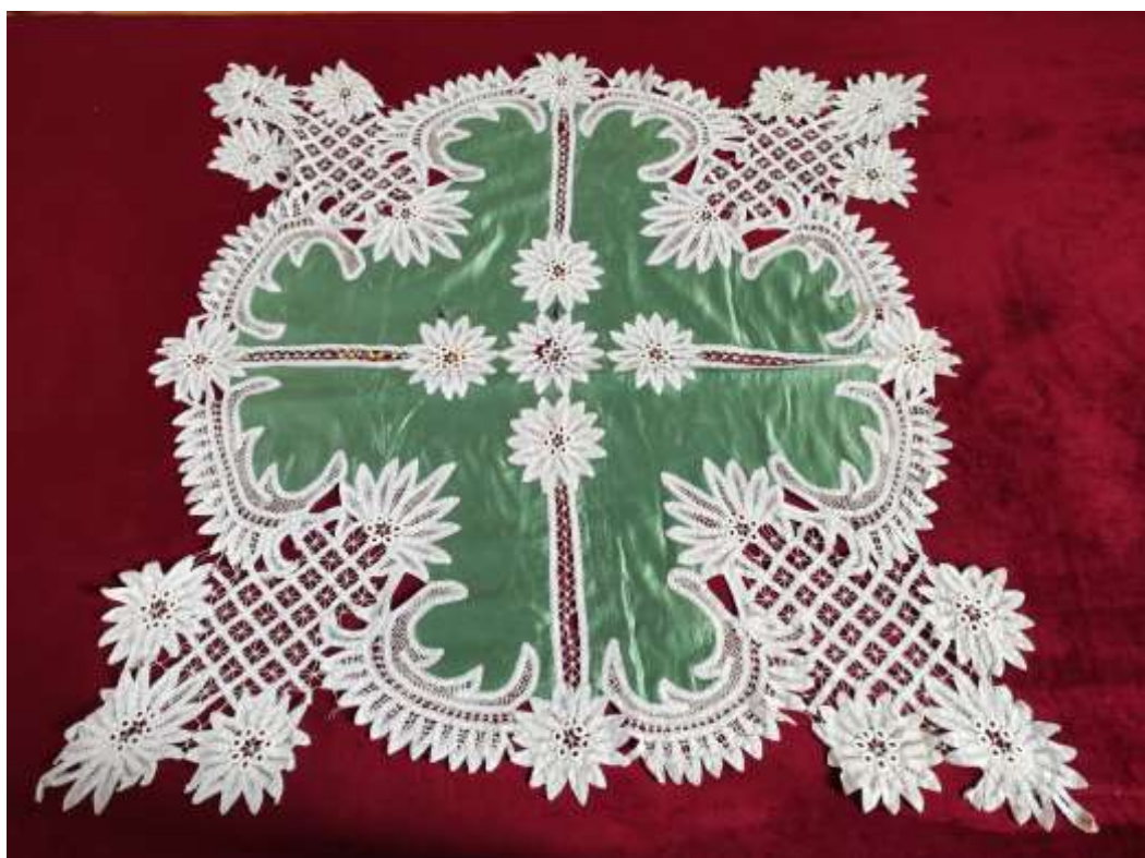
zöld csipketerítő. 2020 20