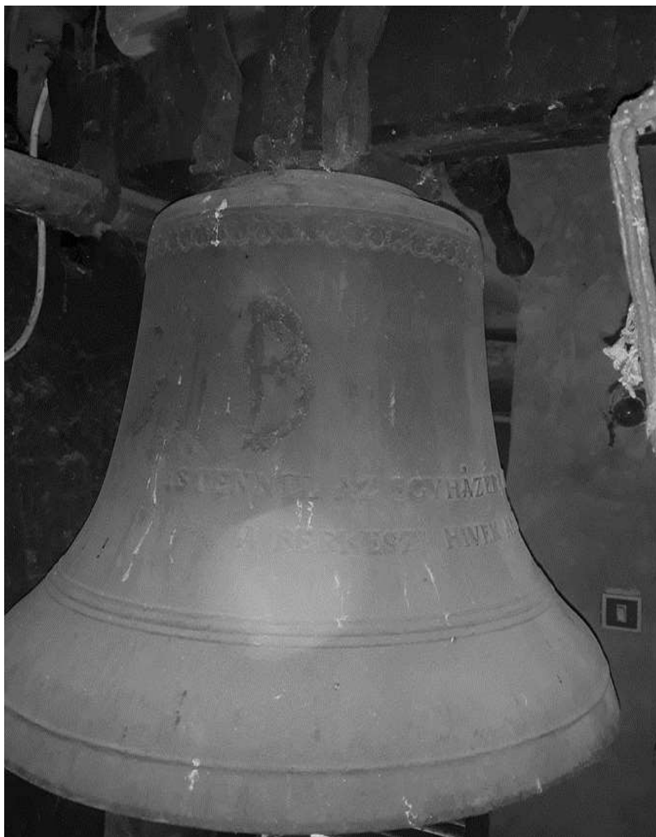
református templom kis harang. 2020 18