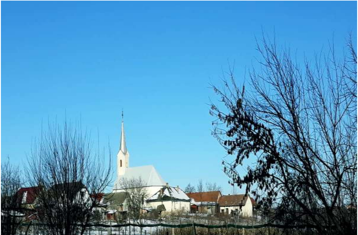
kép: (Ferró Csaba felvétele) református templom. 2019 10