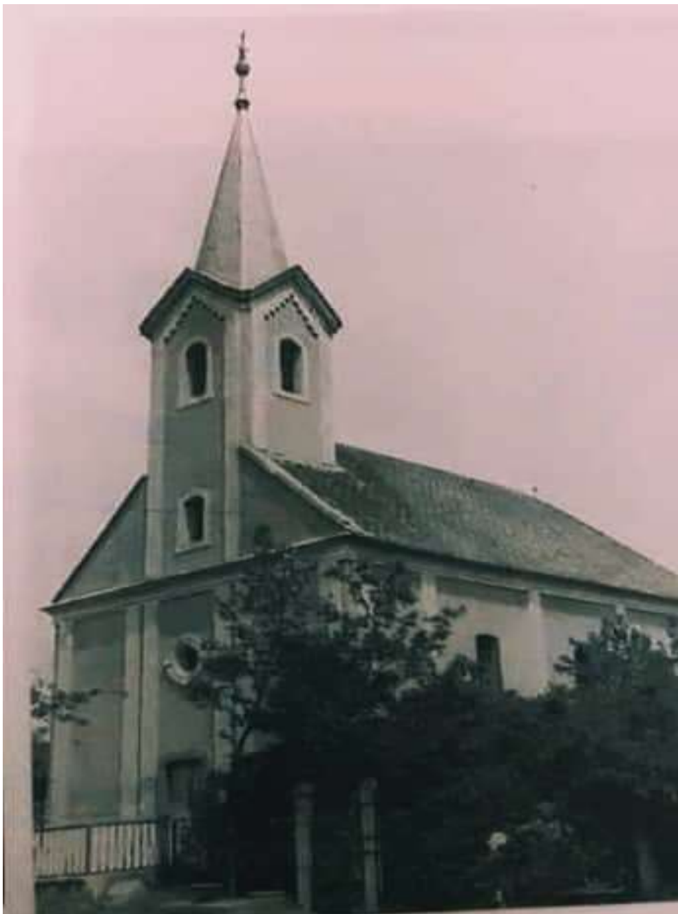
kép: (Várady József könyvének felvétele) református templom. 1991 12