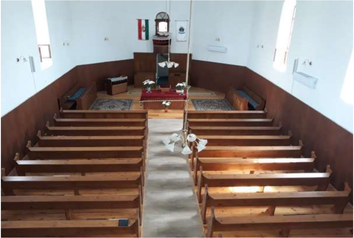
kép: (Ferró Csaba felvétele) református templom belső 2019 11