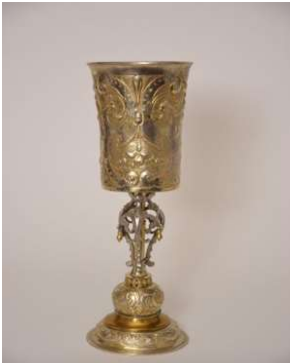
kép: Díszes kehely XVII. századból 14