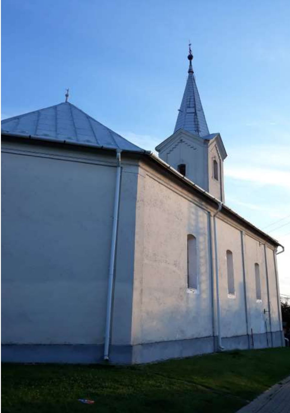
kép: (Ferró Csaba felvétele) református templom. 2019 8