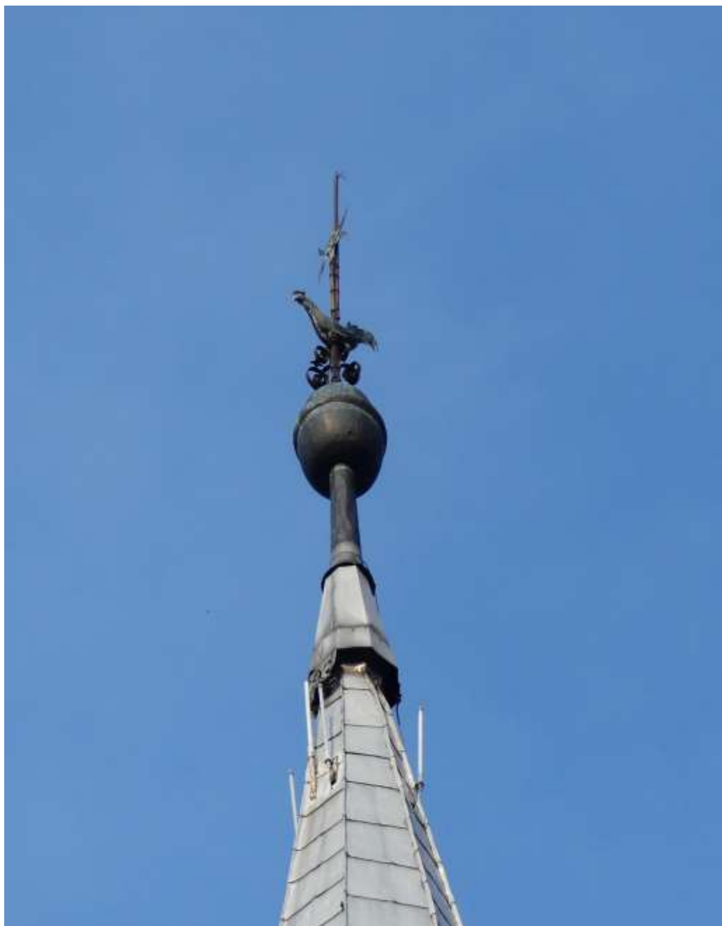
kép: (Ferró Csaba felvétele) református templom. 2019 9