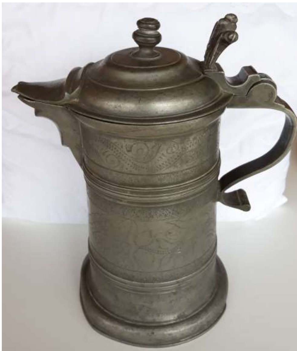
kép: Ón kanna 16