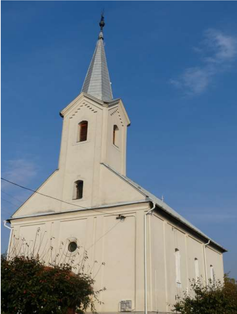
kép: (Ferró Csaba felvétele) református templom. 2019 7

1. Az értéktárba felvételre javasolt nemzeti érték fényképe vagy audiovizuális-dokumentációja: