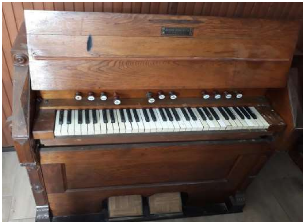
harmónium. 2020 19